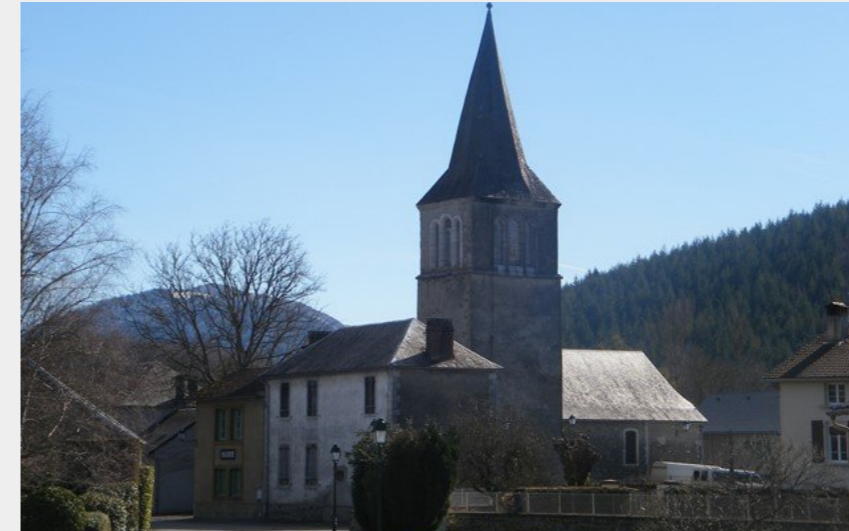
Eglise de Bizous (CCNB)